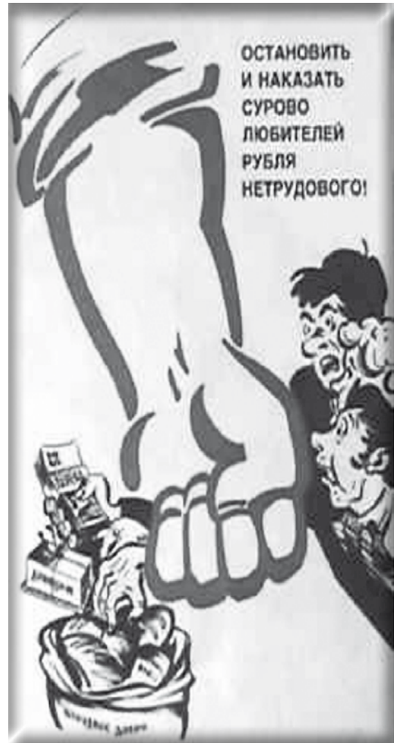
«Punition et châtement pour ceux qui ne travaillent pas.»

Pour résumer, ces appareils de l'Etat bourgeois, parlement et syndicats, que la social-démocratie prétend utiliser dans notre intérêt, ont toujours pour fonction de transformer une revendication prolétarienne qui tend à s'imposer par l'action directe contre le capital en une réforme syndicale ou politique (législation parlementaire) que l'Etat bourgeois concède - qu'il soit ou non conscient de ce processus - dans le but social d'empêcher que cette action remette en question l'essence du capital et de l'Etat.