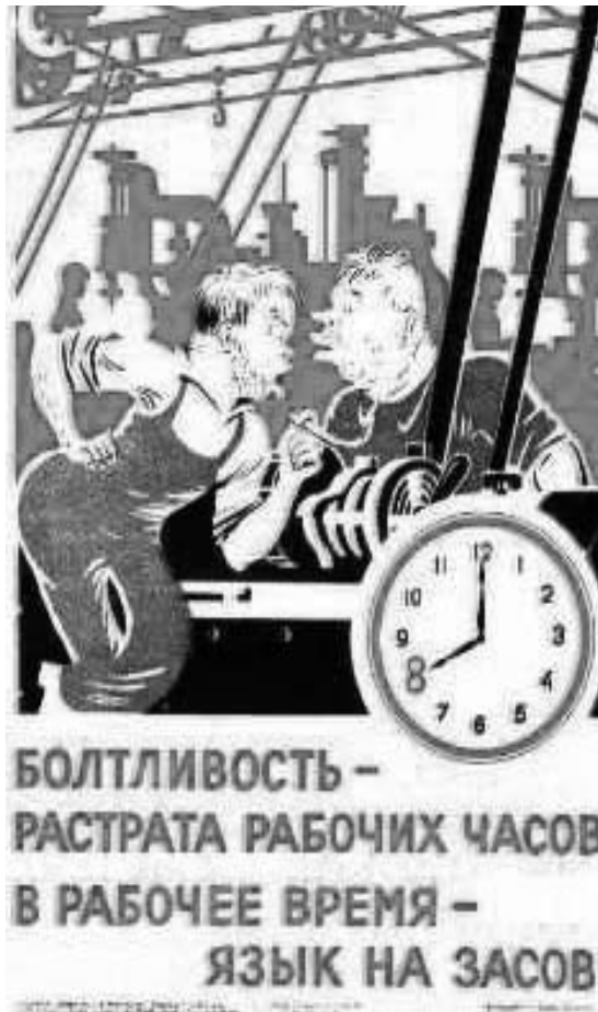
«Ne parlez pas pendant le travail !»

révolutionnaire en Espagne et à la guerre impérialiste. Voilà une histoire emblématique de la manière de transformer la lutte du prolétariat pour ses intérêts en son exact opposé ce qui, comme on le sait, s'est conclu par la transformation des prolétaires en chair à canon, intronisant mondialement Staline, Churchill et Roosevelt. Hé oui, le moindre mal, l'appui critique, le frontisme,... furent bien utiles.