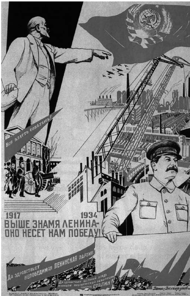
Image classique du culte de la personnalité: «Vive le parti invincible de Lénine. Vive le grand guide de la révolution prolétarienne mondiale, le camarade Staline!» (1934)

(pour le conserver, pour le vendre), il n'est même pas conçu en fonction des besoins humains mais bien du gain maximum. Sa conception ne tient pas compte, par exemple, du besoin de consommer des fibres ou d'être un produit réellement sain, mais d'y ressembler (conservateurs, colorants, ...), ce qui a entraîné une évolution historique de l'appareil digestif humain (intolérance toujours croissante et plus générale au gluten, dégradation des céréales, etc.).