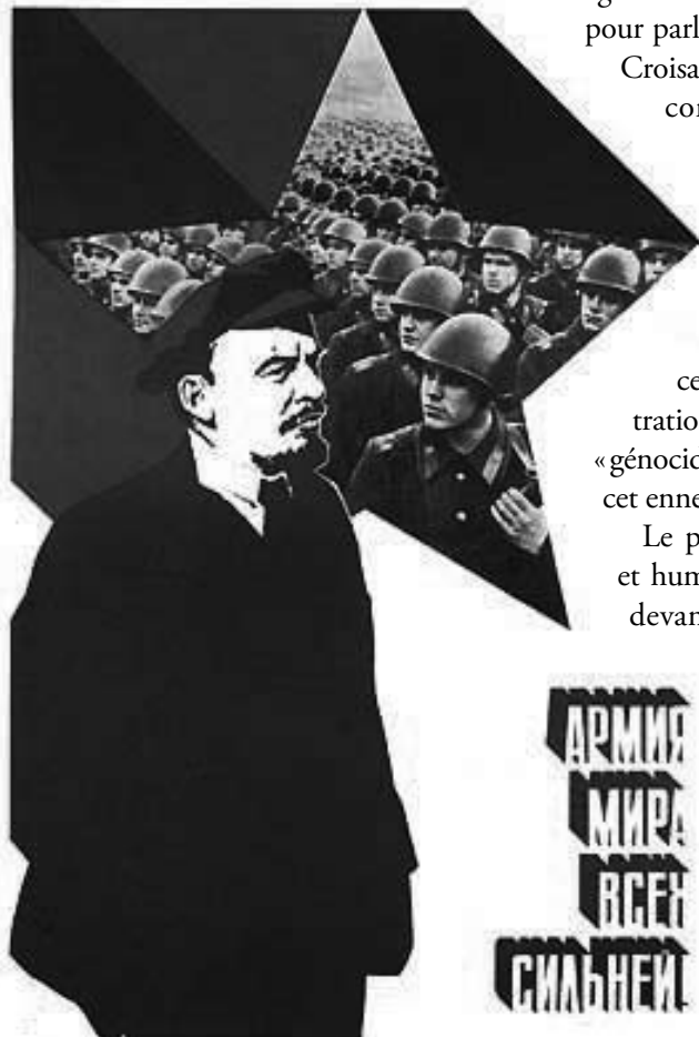
«Longue vie à l'armée de la vie» (SIC !)

Est-ce que, par hasard, ce fut sur le plan militaire? Certainement pas! Ici et là-bas, les prolétaires avaient détruit des armées et des puissances militaires, mais malgré leur victoire, ils étaient prisonniers d'un parti et d'une conception qui les mena, non à la destruction