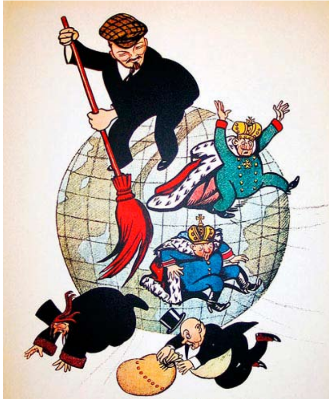
Propagande: construction du mythe «Lénine»

En accusant le bolchevisme d'être antidémocratique, la propagande bourgeoise, y compris et plus particulièrement celle des différents secteurs de la social-démocratie, rehausse le prestige des léninistes vis-à-vis des masses. «Ils travaillent pour nous!» se vantait Lénine, et c'était vrai! Mais cette propagande ne travaillait pas en faveur de la révolution parce que les bolcheviks n'étaient pas ce que la propagande affirmait 54 . Au contraire, cette propagande servit à récupérer des révolutionnaires dans ce projet hybride, centriste qui, dans les faits, reproduisait l'idéologie social-démocrate bien que peinte en l'occurrence sous de plus rouges attrait. Ainsi, non seulement on présentait les bolcheviks comme des partisans invétérés de «l'insurrection, la violence et la terreur» (alors qu'ils défendaient plutôt la démocratie, le parlement, le syndicat, ... et même les coopératives de consommateurs!),