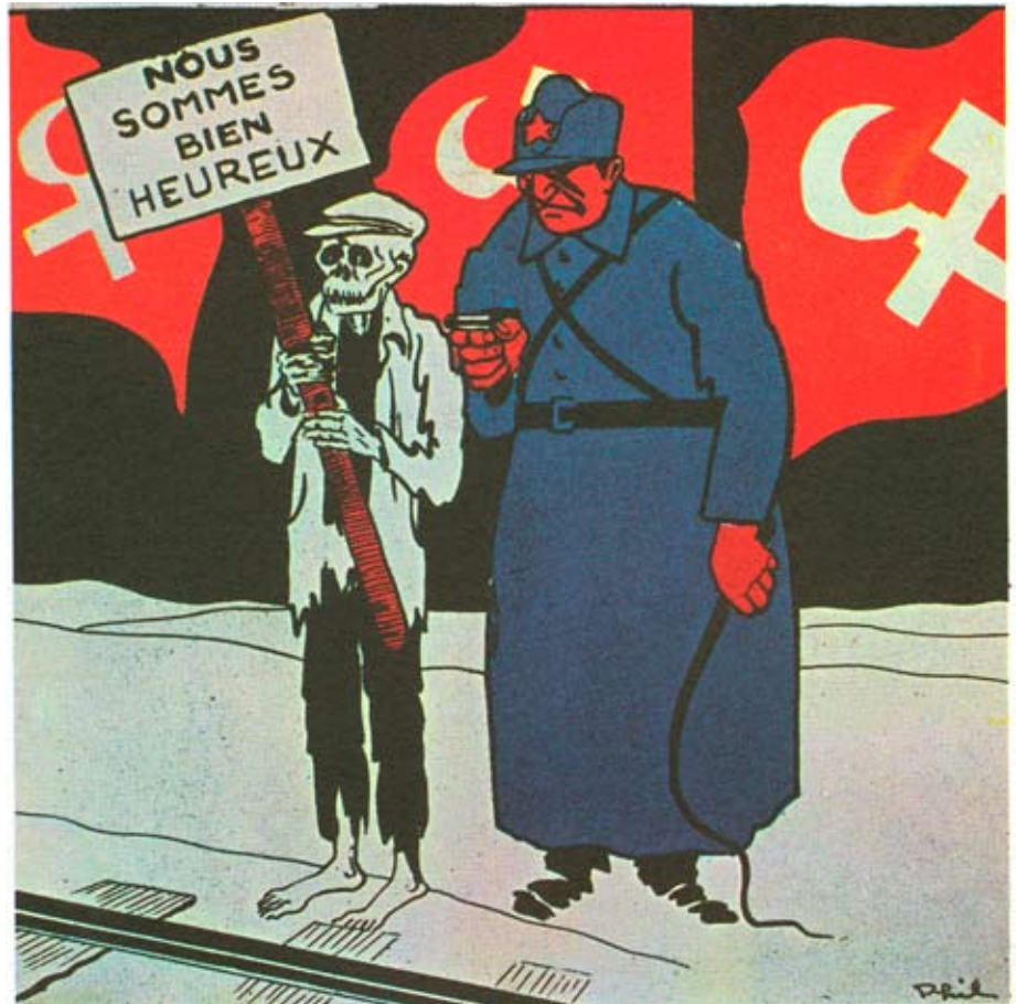
Le paradis soviétique

5. On défend le parlementarisme dans sa globalité et on participe à tout processus électoral, comme l'a toujours fait la social-démocratie.