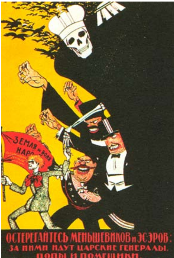
Propagande bolchévique « Méfiez-vous des mencheviks et des SR. Ils sont suivis par les généraux tsaristes, les curés et les propriétaires. » (1920)

L'apologie que Lénine fait du travail et de l'augmentation de la productivité du travail, en les prétendant essentiels à la transition vers le communisme, est totalement contre-révolutionnaire et constitue dans les faits une apologie du capital. Malgré les apparences, ce que Lénine défend ici n'a rien à voir avec l'évidence qu'en période de lutte révolutionnaire, il pourrait arriver que