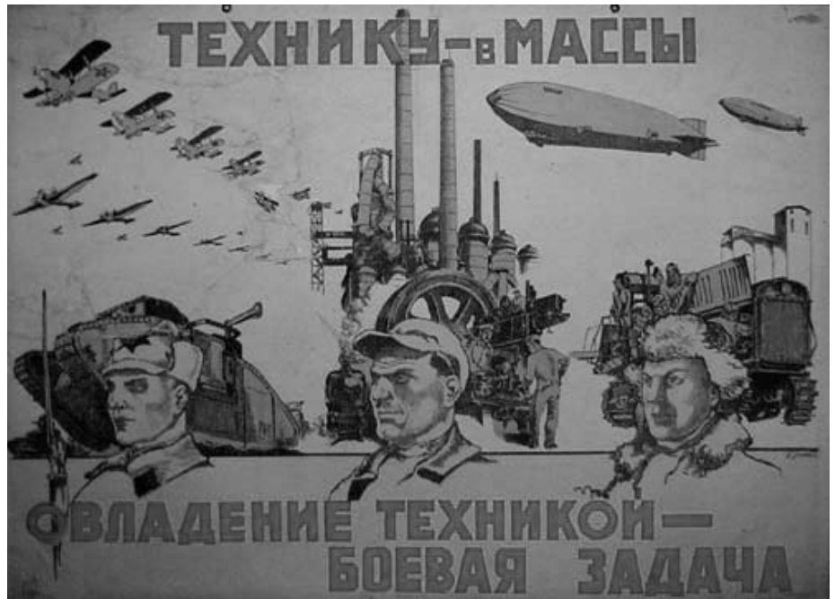
«NOUS APPORTONS LA TECHNIQUE AUX MASSES.»

Pire encore, il est clair que Lénine, comme n'importe quel patron ou économiste vulgaire, identifie productivité et extension du temps de travail. En effet, si nous lisons bien, nous constatons qu'il s'agit d'un mensonge lorsque Lénine dit qu'il y aurait une augmentation de la productivité du travail. Dans l'exemple cité, il n'y a AUCUNE augmentation de la productivité du travail. En effet, comme nous en informe Lénine lui-même, les samedis communistes signifient plus de travail, les prolétaires font des heures supplémentaires sans aucune rétribution. Ce qu'on obtient ainsi n'est absolument pas « une immense augmentation de la productivité » mais que le même travail continue à produire la même chose et que les travailleurs travaillent plus. Le travail n'est pas plus productif, on travaille plus! Le travail serait plus productif si on travaillait autant (ou moins) et qu'avec la même dépense humaine on produisait un résultat supérieur, ce qui, comme le confesse Lénine en nous disant que les prolétaires travaillent plus, n'est pas du tout le cas. Comme en plus ils le font « sans aucune rétribution » ce qui augmente n'est pas la productivité mais le taux de surtravail, le surtravail divisé par le travail nécessaire, le pourcentage qui va au capital (dont