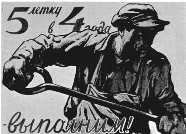
«Le plan quinquennal sera réalisé en 4 ans !»

donc-lui ce mérite, la social-démocratie est le parti du travail 24 . Cette confusion est courante, y compris dans les secteurs qui prétendent être les continuateurs de la gauche communiste 25 . Ce qui est en contradiction avec le capital, ce n'est pas le travail mais le travailleur, et celui-ci ne l'est pas en tant que travailleur mais en tant qu'être humain. Le travail n'est pas contradictoire avec le capital, il en est l'essence ; le travail est la substance même du capital se capitalisant. Dans la contradiction prolétariat/bourgeoisie, le travail, l'exigence de travailler toujours plus, est nécessairement du côté du capital contre l'être humain. Ce dernier, en tant que travailleur, ne s'oppose pas au capital, il lui donne au contraire la vie en renonçant à la sienne pour assurer l'existence de cet être qui le vampirise. Comme travailleur, il ne vit pas comme un être humain, il renonce à son humanité. Ce qu'il vit en tant que travailleur n'est pas sa propre vie. La vie est en dehors du travail ; le travail n'est qu'un