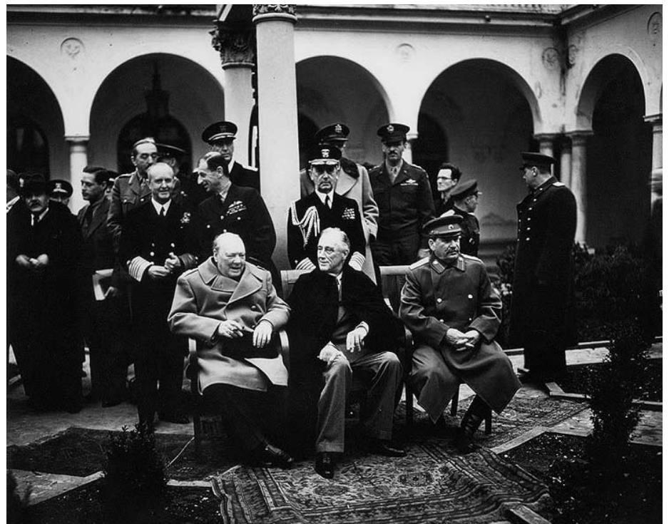
Yalta, 1945: Churchill, Roosevelt et Staline

mouvement communiste. Tout au long du XX ème siècle, la contre-révolution a maintenu son hégémonie totalitariste, l'histoire a été réécrite par ceux qui avaient gagné. Grâce aux efforts déployés à la tête de l'Etat en URSS de même que par les «intellectuels organiques» du capitalisme international, le «socialisme réel», négation absolue du socialisme tout court (sans capital, sans marchandise, sans Etat,...) devint la vérité absolue, l'unique alternative «réelle» au «capitalisme». La manœuvre consistant à faire passer pour «réel» ce que disaient les hommes de l'Etat Russe à propos de leur propre monde (qui, évidemment, concordait avec les intérêts de la bourgeoisie mondiale) fut une opération publicitaire de grande envergure et un succès total. Cela devint l'explication matérialiste, réaliste, au point que le terme «socialisme réel» fut digéré par un grand nombre de ceux qui le critiquaient et qui allèrent jusqu'à adopter cette dénomination absurde. Les professeurs d'Economie Politique