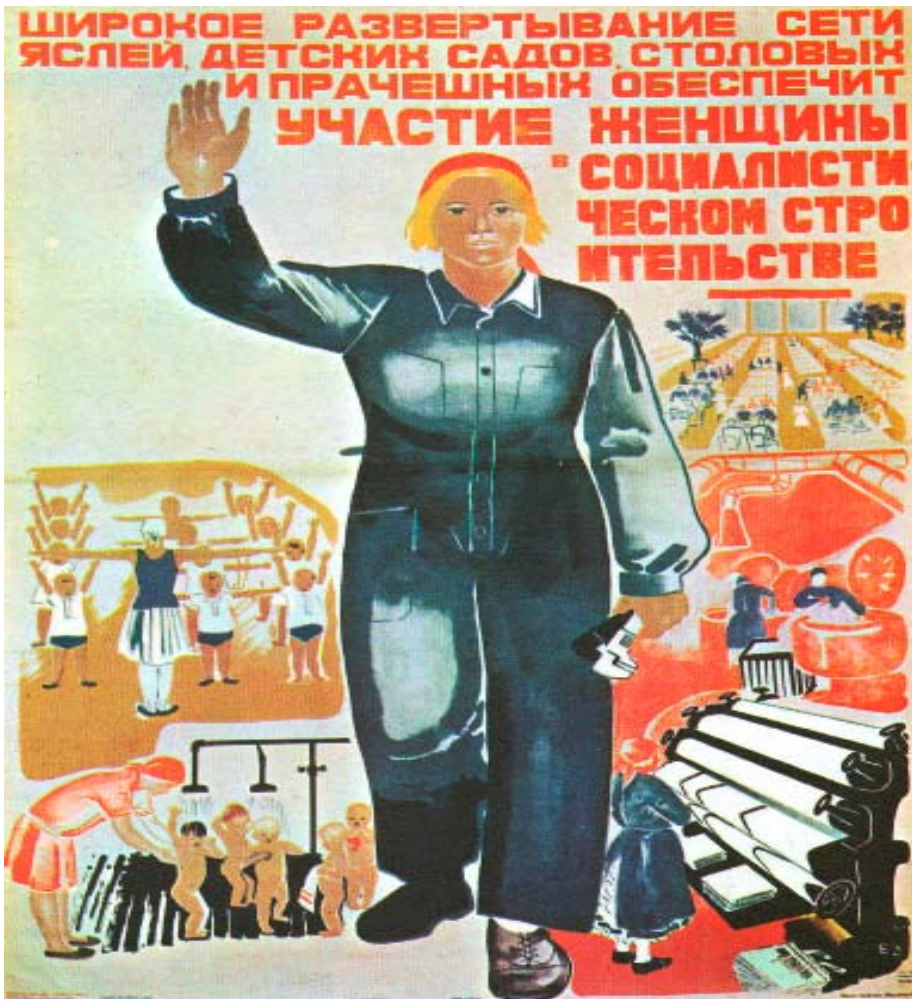
«La femme soviétique doit participer à l'édification du socialisme, la société doit la décharger des tâches domestiques.»

Prenons l'exemple le plus banal: le pain 28 (et non les armes, les compteurs de gaz, les banques, les prisons ou les parlements qu'il faut simplement liquider immédiatement). Non seulement le pain est contaminé par les herbicides, pesticides et autres saloperies chimiques que l'on met sur et dans le blé, la levure et le pain lui-même dans sa phase finale