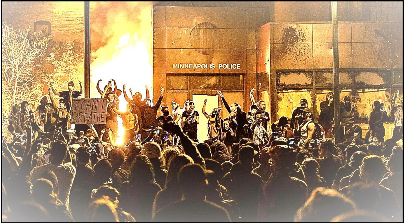
“Minneapolis is Burning”, 29 mai 2020.

L'ANNÉE 2019 A ÉTÉ UNE ANNÉE DE MOUVEMENT DE CLASSE MONDIAL d'une ampleur et d'une intensité jamais vues depuis des décennies, peut-être depuis la vague des luttes révolutionnaires des années 60 et 70. La normalité capitaliste du business as usual a été profondément ébranlée par une myriade de manifestations, de grèves, d'émeutes et même, dans certains endroits, de mutineries dans les forces armées et la police. Des centaines de milliers de prolétaires en colère sont descendus dans les rues du Chili, de la France, du Liban, de l'Irak, d'Haïti, de Hong-Kong, de l'Iran, de l'Inde, de la Colombie et de bien d'autres endroits... Pour de nombreux militants communistes, ces mouvements représentaient une bouffée d'air frais. Sur cette lancée, nous observons les émeutes à Sao Paulo, à Recife, à Rio ou encore l'occupation du métro à New York ou les protestations contre les entreprises polluantes à Wenlou dans le delta de la rivière des Perles dans l'espoir que ce sont là les signes que la révolte prolétarienne se propage telle une trainée de poudre et commence à englober ces immenses centres d'accumulation du Capital. Le Nouvel An arriva et le mouvement ne montra aucun signe de perte d'énergie. Au contraire, de nouvelles éruptions apparaissaient presque chaque semaine dans une autre ville, une autre région, un autre pays... Et puis, trois mois après le début de l'année 2020, tout s'est arrêté brusquement. Du moins en apparence.